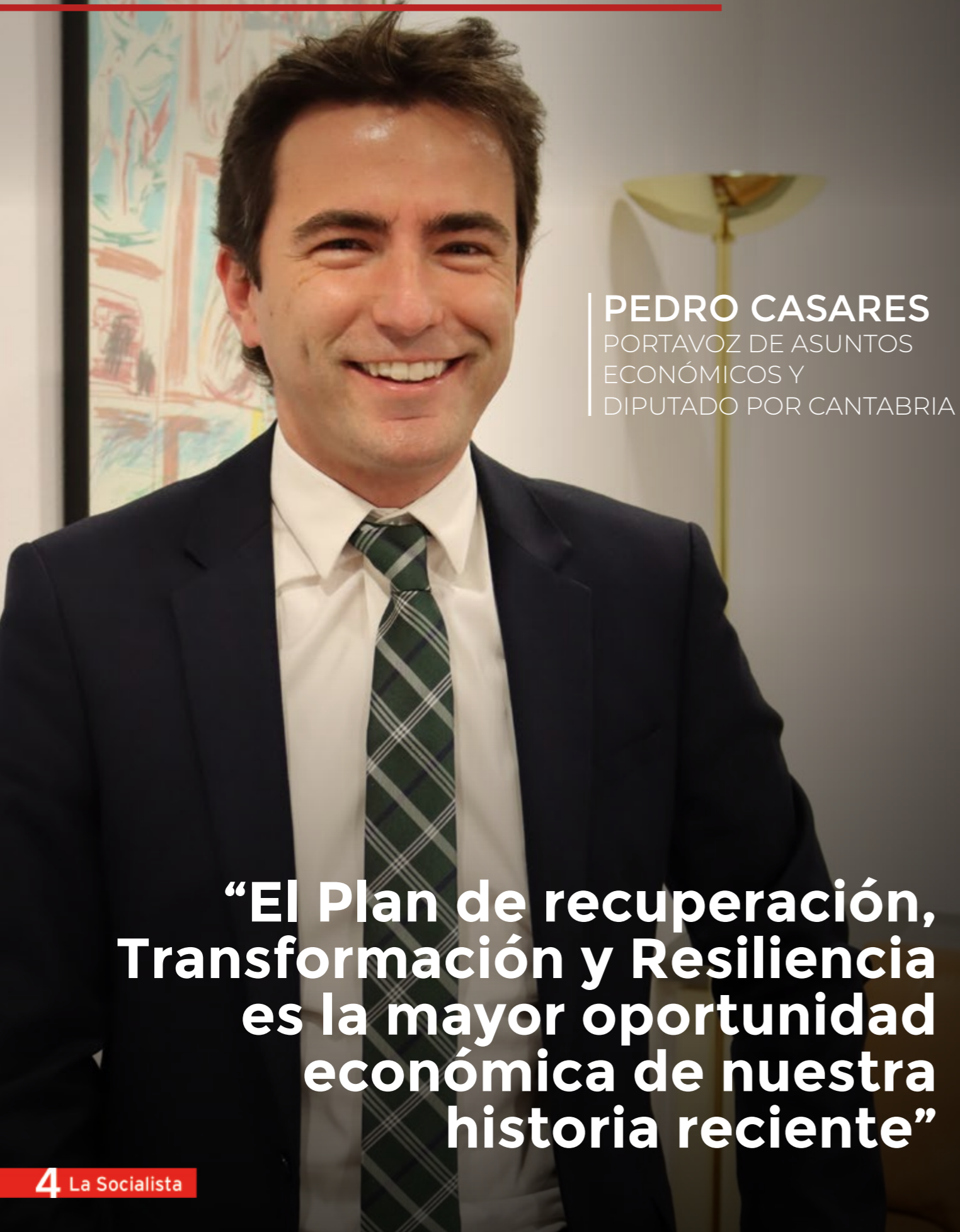
PEDRO CASARES PORTAVOZ DE ASUNTOS ECONÓMICOS Y DIPUTADO POR CANTABRIA

“El Plan de recuperación, Transformación y Resiliencia es la mayor oportunidad económica de nuestra historia reciente”